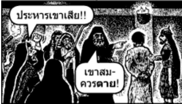
อ่าน "Illegal Trial of Jesus" โดย Wingo

พวกเขาจัดให้มีการพิจารณคดีในตอนกลางคืน ในคืนก่อนวันเทศกาลปัสกา และใช้พยานเท็จ กระทั่งปุโรหิตใหญ่ก็ต้องการให้พระองค์ถูกประหารชีวิต